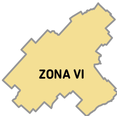
Imagen 2. La Zona VI está conformada por los Partidos: 25 de Mayo, General Alvear; General Las Heras, Las Flores, Lobos, Navarro, Roque Pérez, Saladillo.