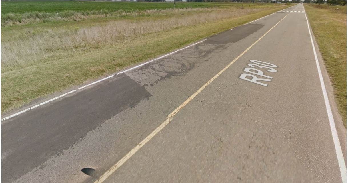
Imagen 3. Deterioro en la R.P. N°30. Partido de Las Flores.