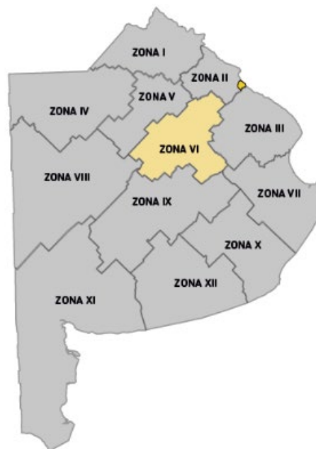
Imagen 1. División de Zonas Viales de la Provincia de Buenos Aires

En las siguientes imágenes se muestra la Zona VI sobre la Provincia de Buenos Aires, la cual será el área a intervenir: