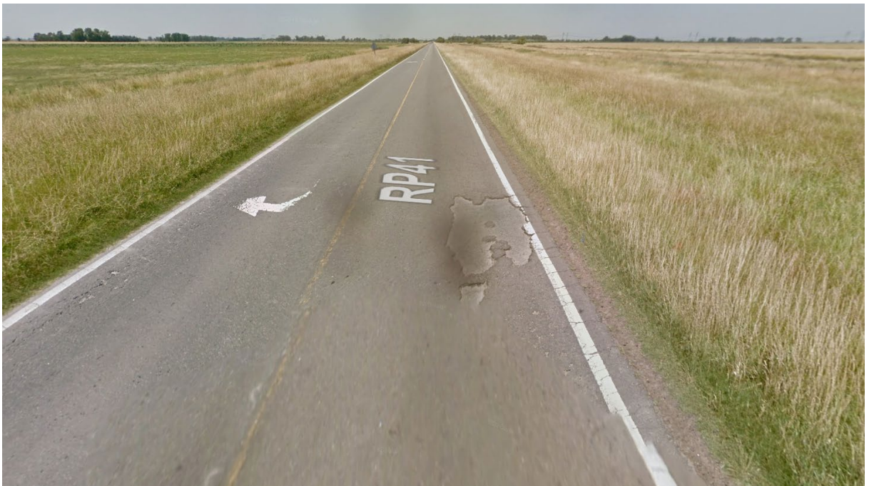
Imagen 4. Deterioro en la R.P. N°41. Partido de Navarro